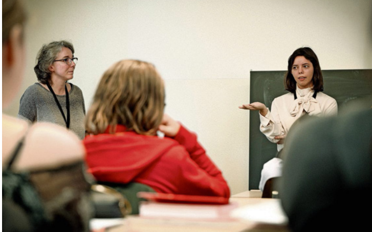
Une trentaine de professionnels ont partagé leur vécu avec les élèves de dernière année lors d'une matinée d'échanges.