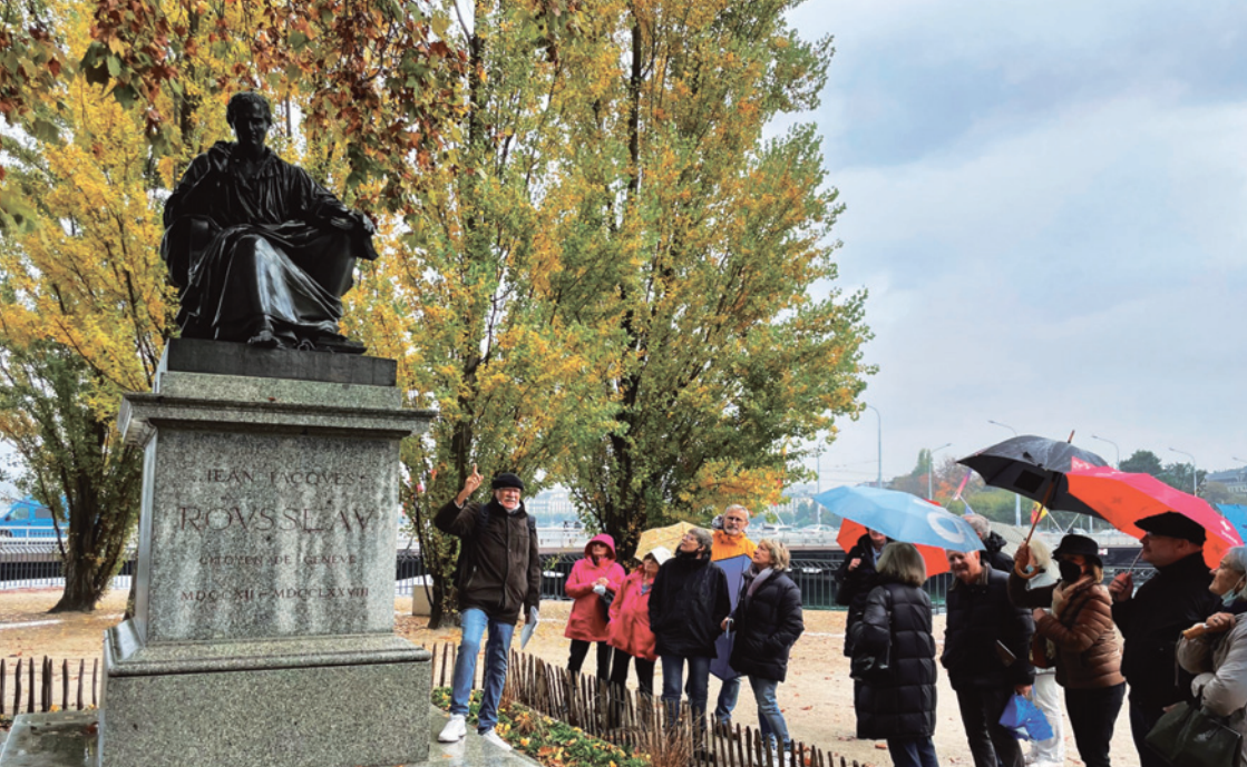
Halte à l'île Rousseau, lors du parcours de Jean-Jacques Rousseau du 30 octobre 2021.

Au demeurant la plaque n'indique pas qu'il est né là. Elle se borne à rappeler la décision du gouvernement de consacrer une rue à son nom. Cette rue s'appelait précédemment la rue Chevelu du nom d'un important propriétaire de ce quartier.